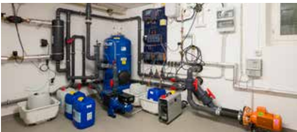
Die Topras-Pooltechnik ist im Keller des Wohnhauses untergebracht. Die automatisch arbeitende Anlage sorgt für sehr gute Wasserqualität.

85591 Vaterstetten, Tel.: 08106/9958320 info@topras.de, www.topras.de